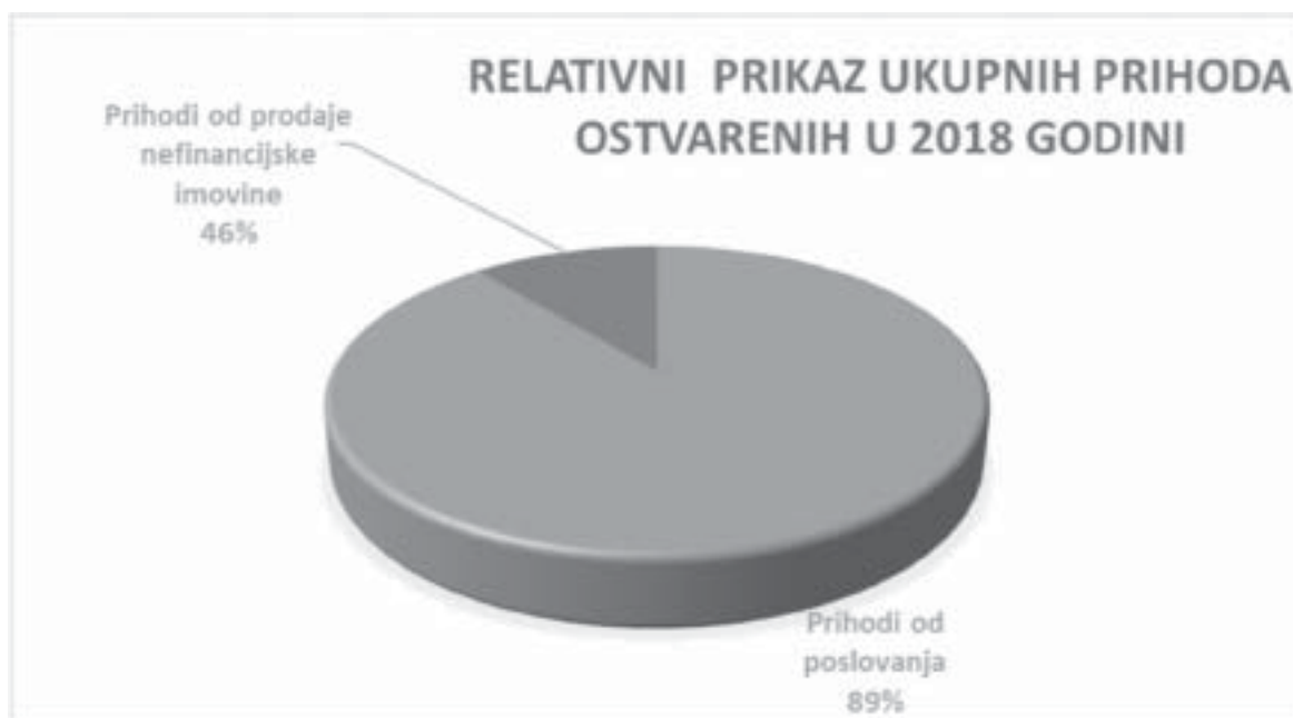
Grafikon 1. Relativni prikaz ostvarenih prihoda u 2018. godini

Prihodi od poslovanja veći su za 7,96%, dok su prihodi od nefinancijske imovine manji za 84,58% u odnosu na prethodnu godinu (Grafikon 2.). Razlog navenom je ostvarena Prodaja zemljišta u 2017. godini u iznosu od 20.156.173,20 kn.