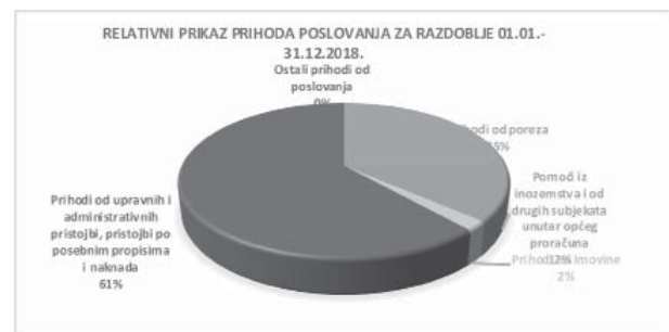
Grafikon 4. Relativni prikaz ukupnih Prihoda poslovanja

komunalne naknade, naknade za pripremu građevinskog zemljišta, udio investitora u izgradnji komunalnih objekata te doprinosa za šumu). Najveći udio u prihodima ove skupine odnosi se na prihode Komunalne naknade koji su planirani u iznosu od 14.300.000,00 kn a ostvareni u iznosu od 14.160.725,29 kn. Izvršenje komunalne naknade je 99,02% plana, te je veća za 10,37% od prethodne godine. Prihodi Komunalnog doprinosa ostvareni su u iznosu od 2.163.706,65 kn (99,71% plana) te su se smanjili u odnosu na 2017. za 5,99%. Relativan iskaz svih prihoda od poslovanja ostvarenih za razdoblje od 1. siječnja do 31. prosinca 2018. godine, prikazani su na Grafikonu 4.