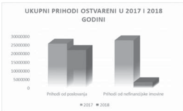
Grafikon 2. Ukupni prihodi ostvareni u 2017. i 2018. godini