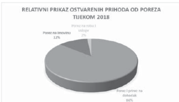
Grafikon 3. Relativni prikaz ukupnih prihoda od poreza

Prihodi od pomoći iz drugih proračuna, odnosno se na kapitalne pomoći županijskog proračuna (786.525,55 kn) i Županijske uprave za ceste (2.451.470,69 kn), koji ukupno iznose 3.237.723,24 kn, odnosno 11,69% ukupnih Prihoda poslovanja, te su u odnosu na 2017. godinu umanjani su za 34,17%. Prihodi od imovine iznose 541.002,18 kn, u najvećem dijelu se odnose na Prihode od zakupa (226.916,46 kn) i Naknade za korištenje nefinancijske imovine (231.313,21 kn).